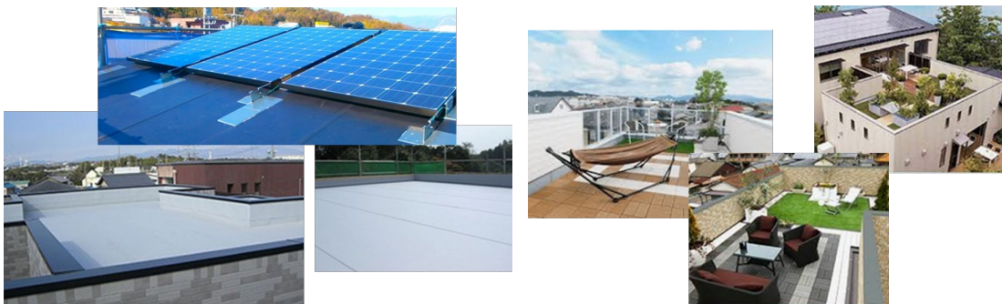
陸屋根「スカイプロムナード」・屋上緑化「OSORAリビング」

この度の株式取得により、当社グループは国内の戸建て住宅マーケットにおけるシェアアップを果たし、栄住産業の拠点網を活かした住宅資材等の更なる販路拡大により、住宅・不動産関連事業の更なる成長が図れるものと判断し、栄住産業の全株式を取得することいたしました。