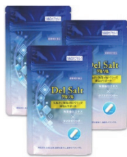
Del Salt (デルソル) ( https://delsalt.jp/ )